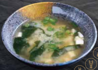
1 Sopa de miso · Sopa de miso