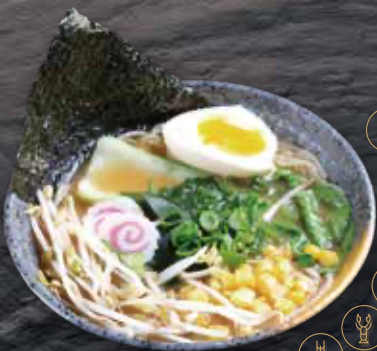
2 Ramen · Ramen