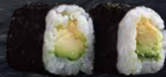
62 Alvocat (4u.) · Aguacate