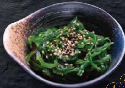
3 Wakame · Wakame