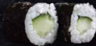
65 Cogombre (4u.) · Pepino