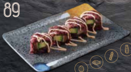
Arròs negre, salmó, alvocat (4p.)