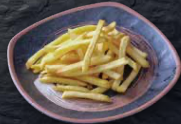
14 Patates fregides · Patatas frites