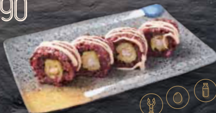
Arròs negre, tempura de llagostí (4p.)