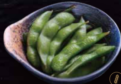
6 Edamame · Edamame