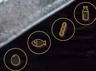
Salmó, avocat, kataifi (4p.)