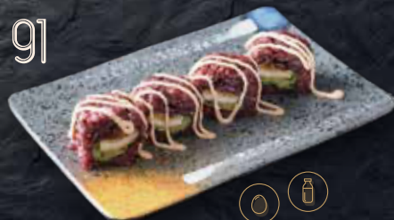
Arròs negre, pollastre fregit, enciam (4p.)