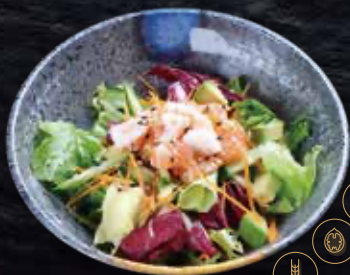
4 Amanida de la casa · Ensalada de la casa