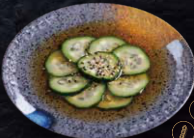
5 Amanida de cogombre · Ensalada de pepino